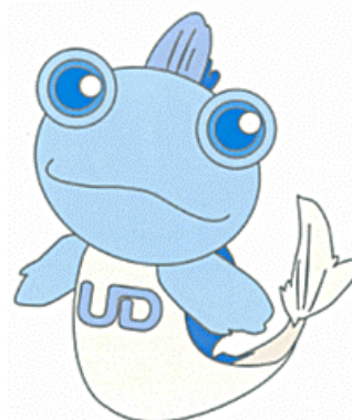
佐賀UDキャラクター ゆうちゃん