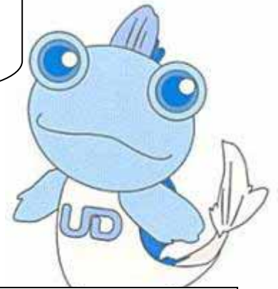
佐賀県UDキャラクター ゆうちゃん