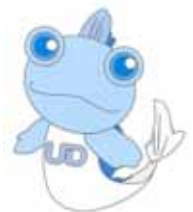
佐賀県UDキャラクター ゆうちゃん