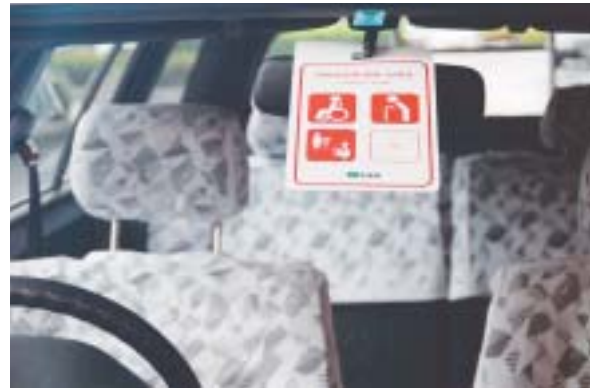
身障者用駐車場に駐車するときは、ルームミラーにかけて利用します。