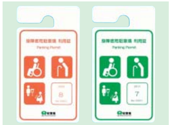
右(緑): 身体障害者、高齢者や難病などで歩行が困難な方(5年) 左(オレンジ): けがや妊娠などで一時的に歩行が困難な方(1年未満)